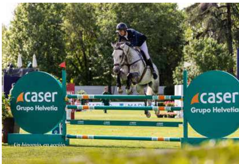
Un binomio, en acción.