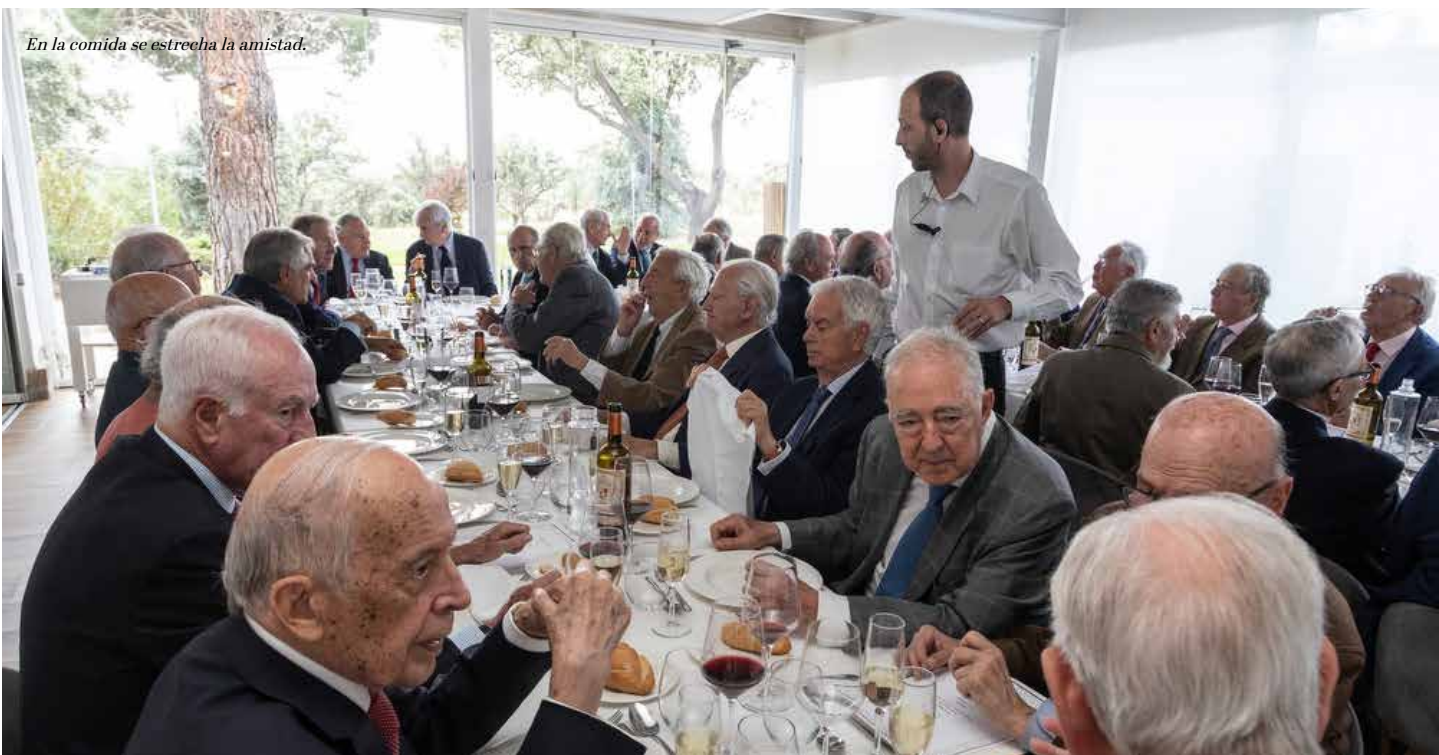
En la comida se estrecha la amistad.