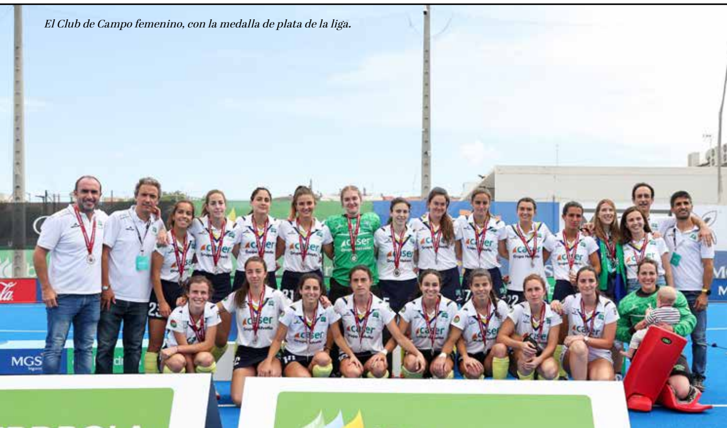
El Club de Campo femenino, con la medalla de plata de la liga.