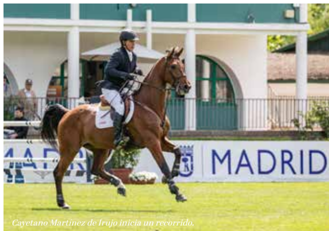
Cayetano Martínez de Irujo inicia un recorrido.