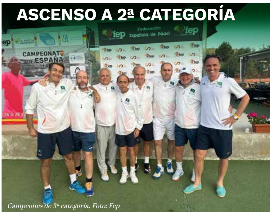
Campeones de 3ª categoría.

El equipo de pádel +50 del Club ganó el V Campeonato de España por equipos de 3ª categoría y certificó su ascenso a la división de plata en el torneo disputado en mayo en Alicante.