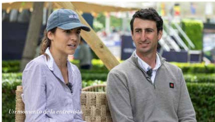
Un momento de la entrevista.

cos. Es un gran jinete. Que siga trabajando como lo está haciendo porque está entre los mejores de España.