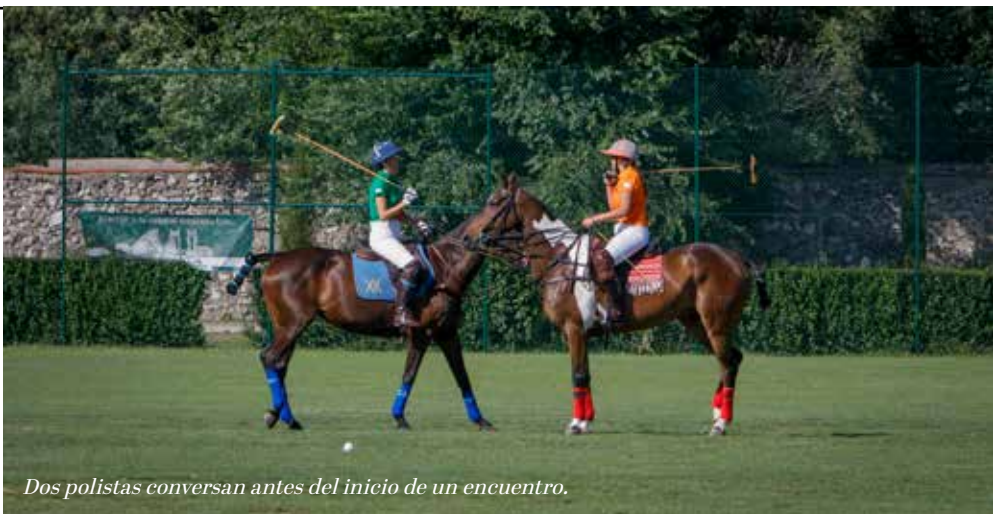
Dos polistas conversan antes del inicio de un encuentro.