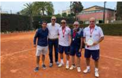
Subcampeones de España +65.