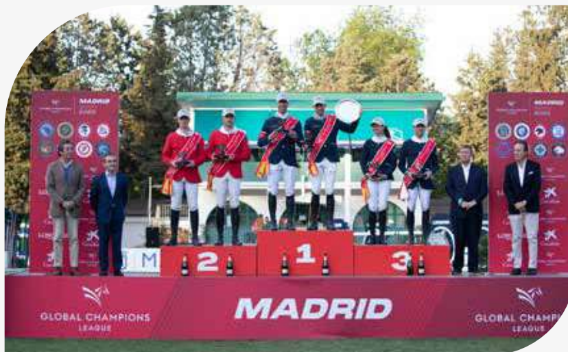
TROFEO CAIXABANK - GCL (1,55/1,60m)