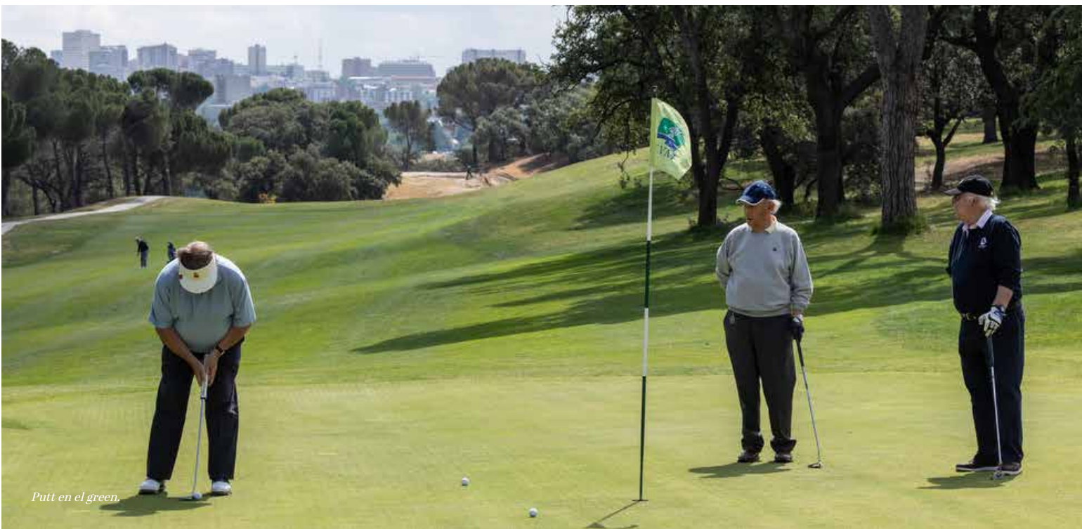
Putt en el green.