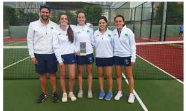
El equipo júnior femenino de 2ª categoría.