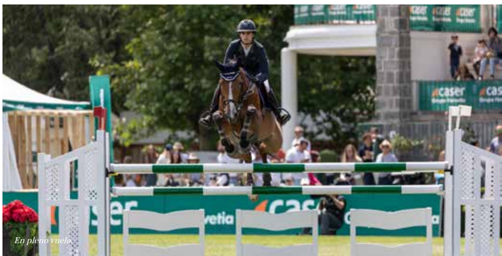
En pleno vuelo.