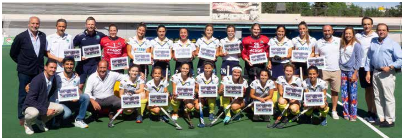
El Club de Campo femenino, plata en la EHL.