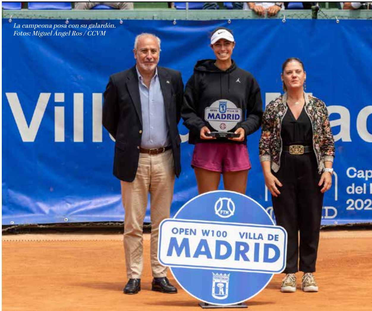
La campeona posa con su galardón.