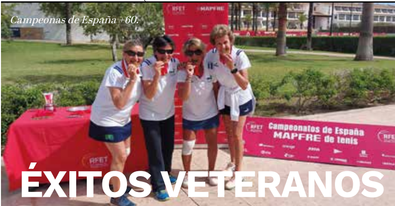
Campeonas de España +60.