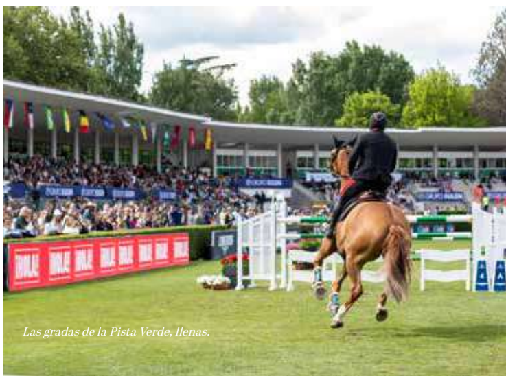
Las gradas de la Pista Verde, llenas.