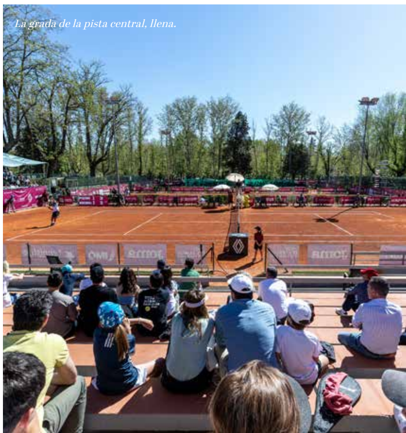
La grada de la pista central, llena.

En la segunda manga, Shevchenko puso la directa hacia la victoria final y se colocó 5-2. Cachín tiró de garra para hacer un último break y prolongar un juego más un encuentro del que disfrutaron en las gradas más de un millar de espectadores, pero