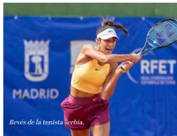
Revés de la tenista serbia.