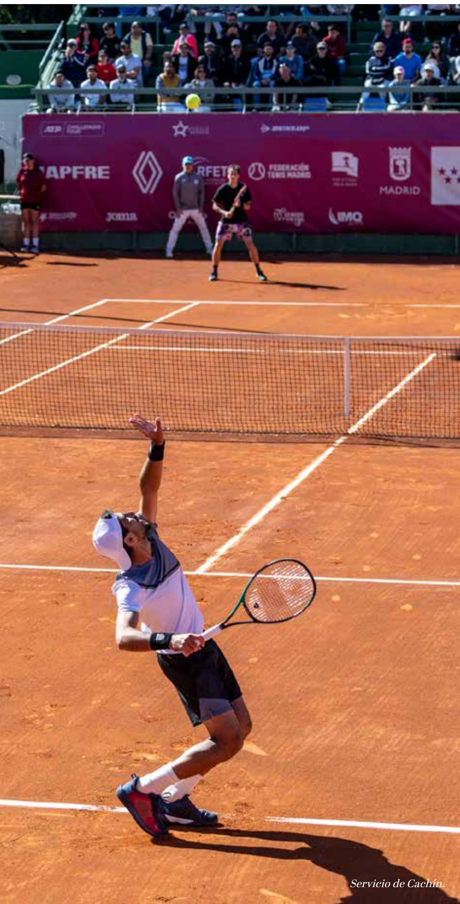
Servicio de Cachín.

la remontada del argentino resultó imposible. "Ha sido un placer jugar en el Club y conseguir esta victoria ante un público con tanta pasión como es el español. Creo que al principio del torneo no estaba jugando muy bien, pero, según han pasado los partidos, he ido mejorando hasta conseguir el triunfo", declaró el campeón tras la entrega de premios.