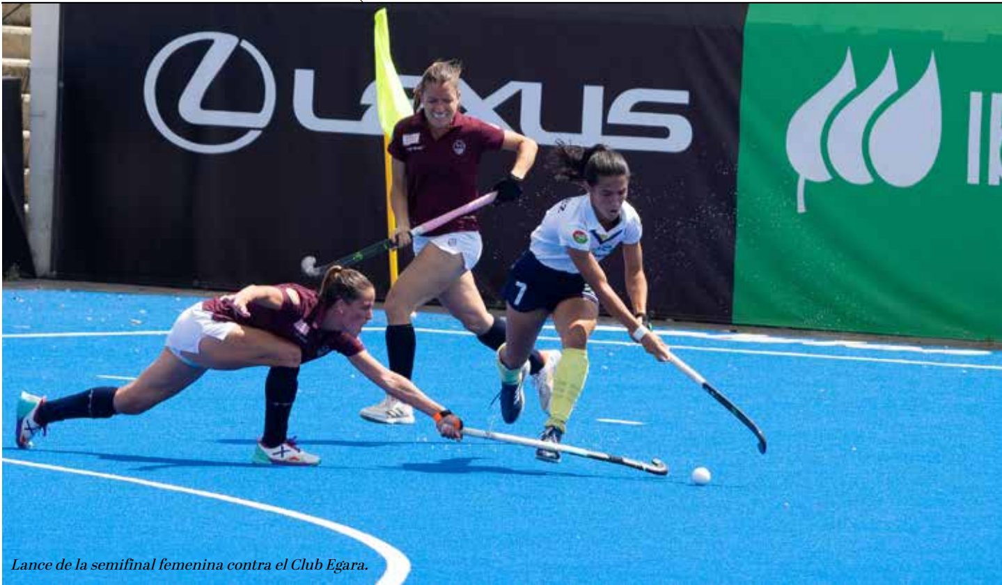
Lance de la semifinal femenina contra el Club Egara.