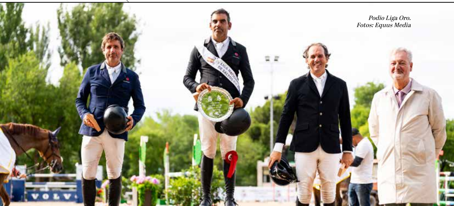
Podio Liga Oro.