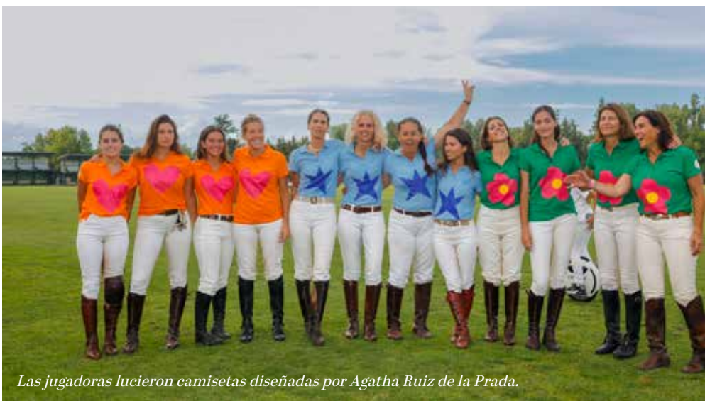
Las jugadoras lucieron camisetas diseñadas por Agatha Ruiz de la Prada.