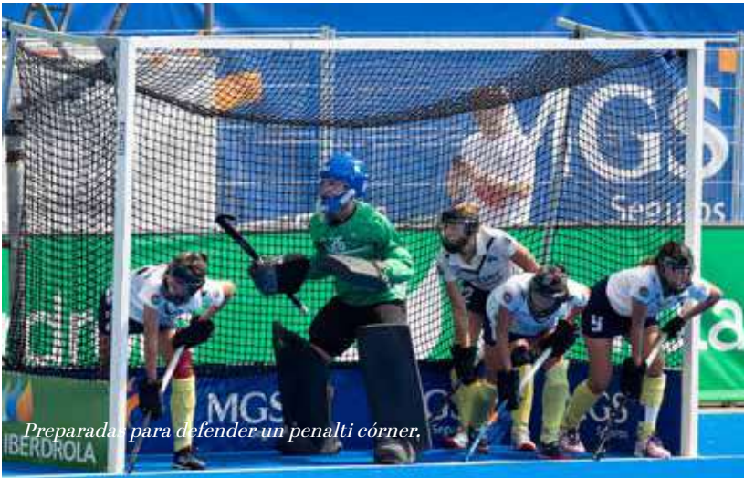
Preparadas para defender un penalti córner.