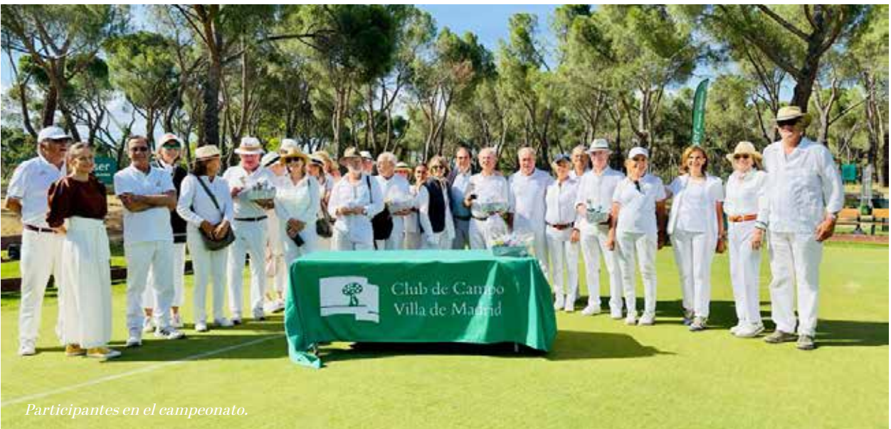
Participantes en el campeonato.