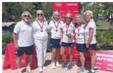
Campeonas de España +65.

Los equipos femeninos del Club +60 y +65 consiguieron en mayo el título en el Campeonato de España celebrado en las pistas del Club Deportivo Font de Sa Cala de Mallorca.