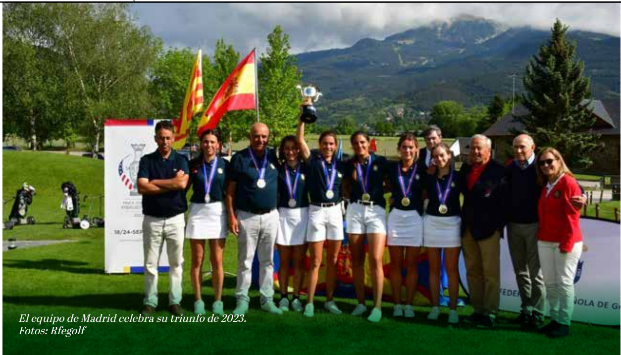
El equipo de Madrid celebra su triunfo de 2023.