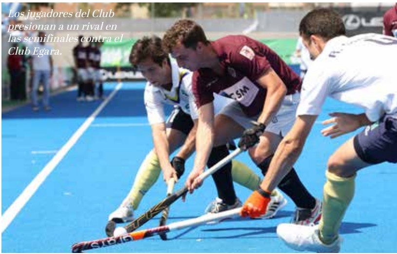
Los jugadores del Club presionan a un rival en las semifinales contra el Club Egara.