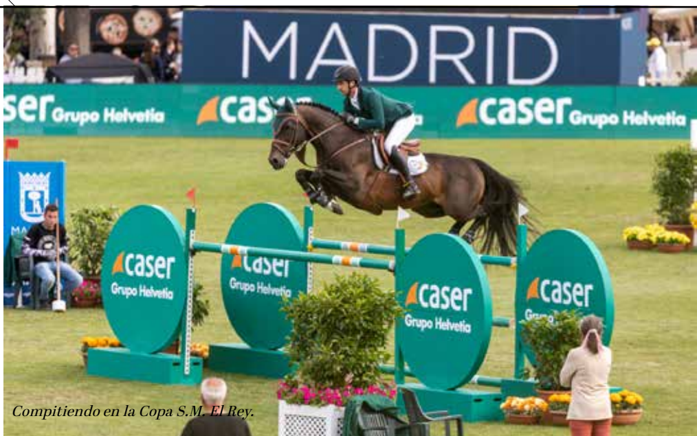
Compitiendo en la Copa S.M. El Rey.