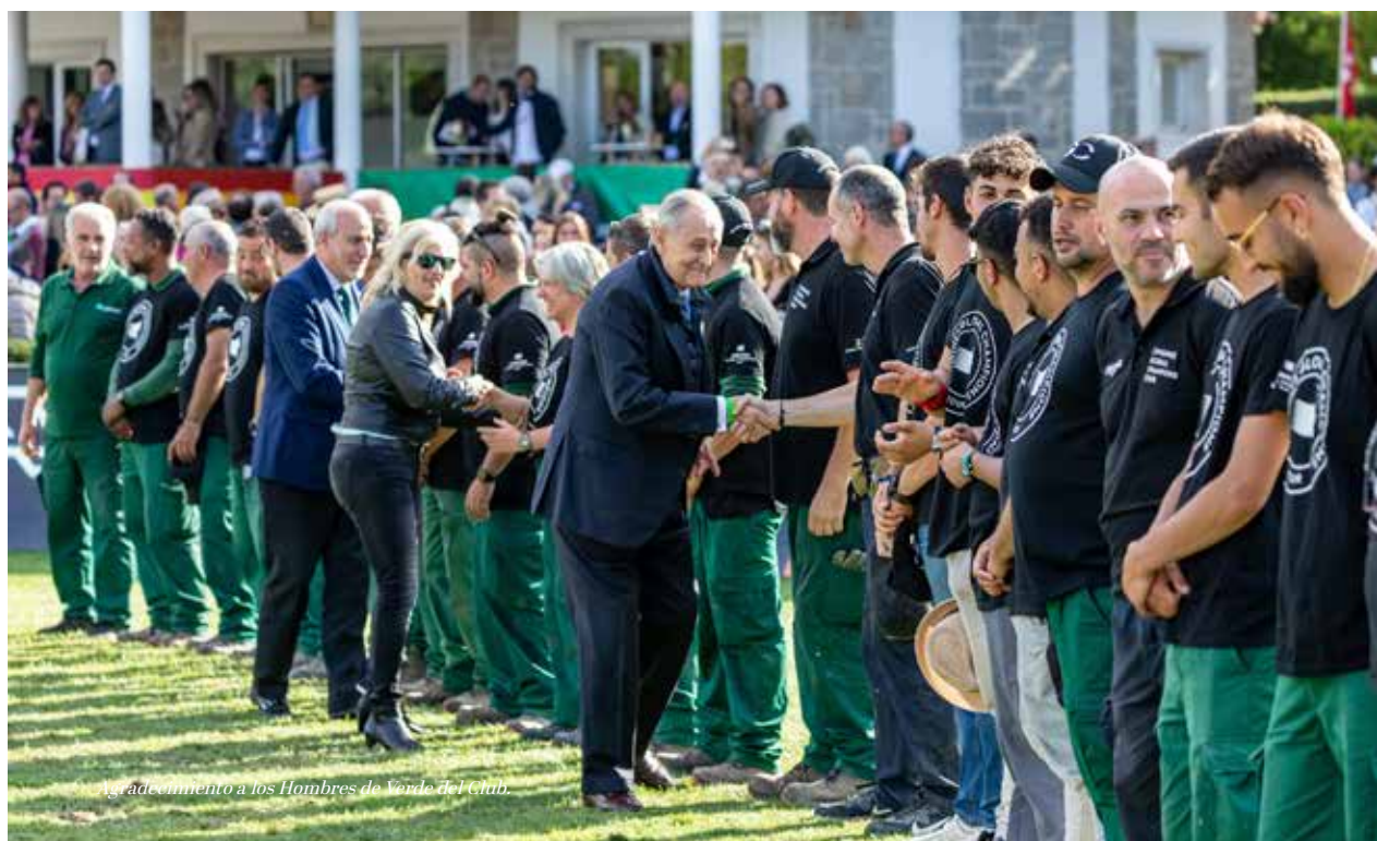
Agradecimiento a los Hombres de Verde del Club.