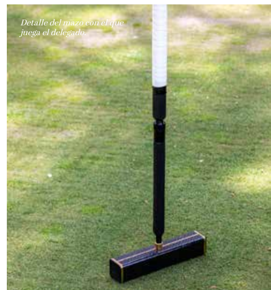
Detalle del mazo con el que juega el delegado.