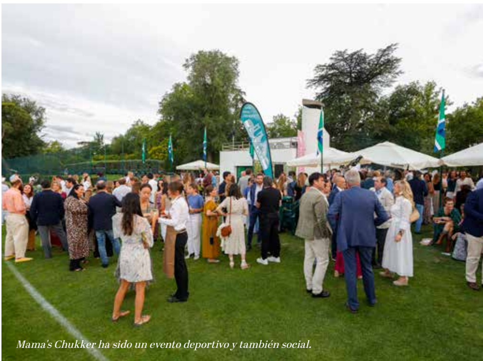
Mama's Chukker ha sido un evento deportivo y también social.