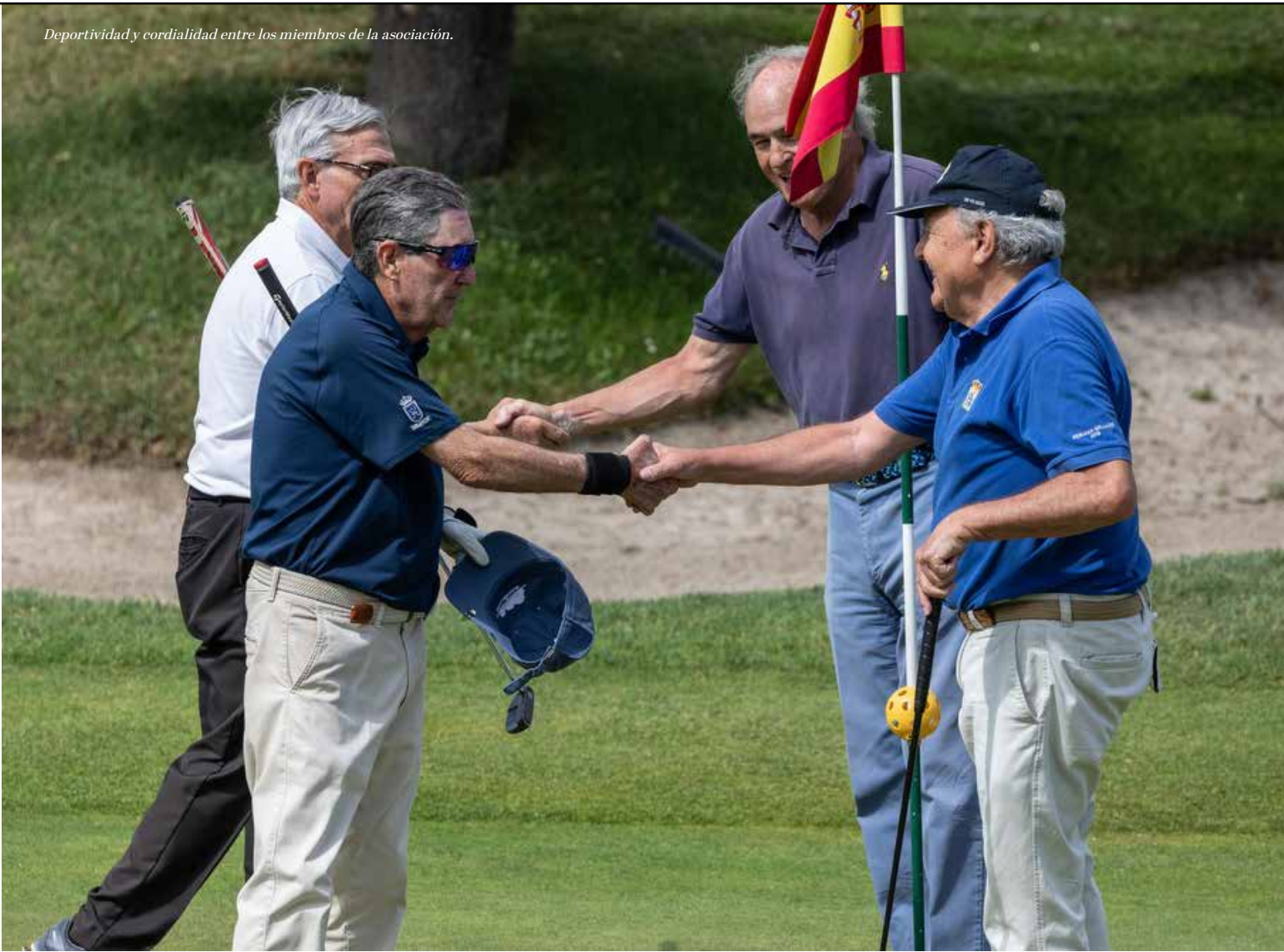
Deportividad y cordialidad entre los miembros de la asociación.