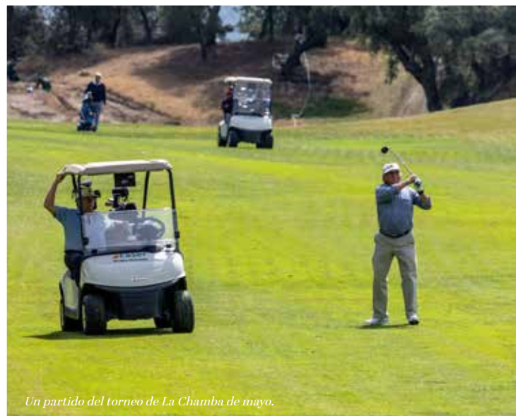
Un partido del torneo de La Chamba de mayo.