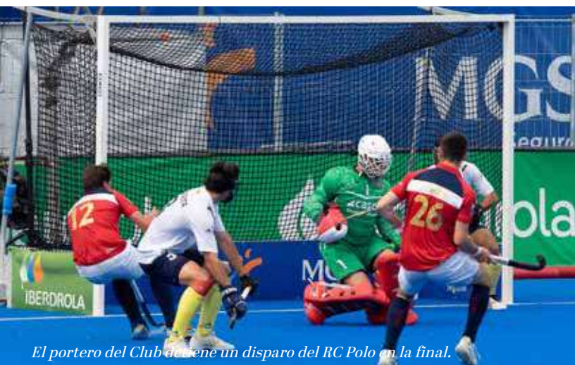
El portero del Club de Campo tiene un disparo del RC Polo en la final.