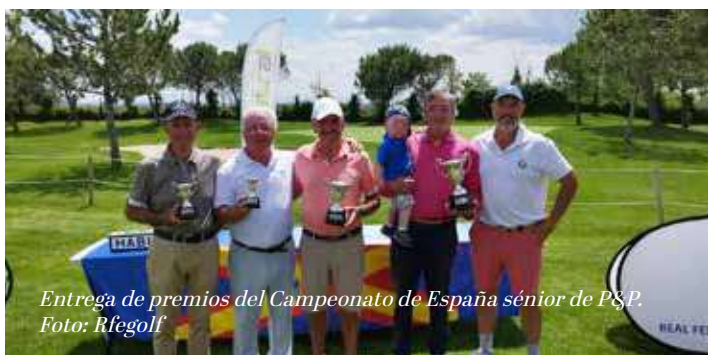
Entrega de premios del Campeonato de España sénior de P&P.